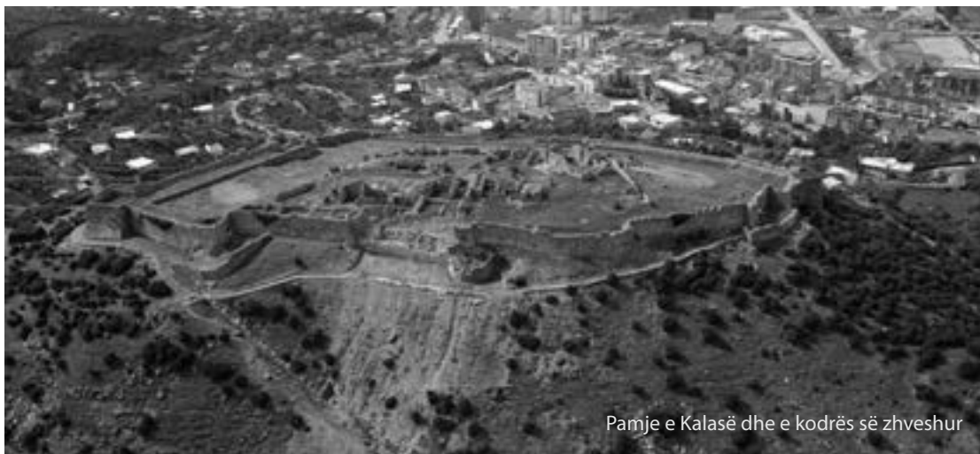
Pamje e Kalasë dhe e kodrës së zhveshur

"Pyje mbrojtëse" janë pyjet e përcaktuara kryesisht për qëllime mbrojtëse të vetë pyllit, të tokës pyjore dhe të tokave që shtrihen përreth zonës urbane dhe fshatrave, pellgjeve ujëmbledhëse, për të luftuar a parandaluar dukuritë e gërryerjes, të ndikimit të erërave, çrregullimeve në rrjedhjet ose burimet ujore dhe sigurimin e funksioneve ekologjike. Drejtoria e Bujqësisë, Pyjeve dhe Zhvillimit Rural pranë bashkisë Lezhë ka ngritur një grup pune me inxhinierë pyjesh, agronomë dhe ekonomist për të hartuar një projekt pyllëzimi në zonën e Kalasë me qëllim krijimin e pyllit artificial mbrojtës.