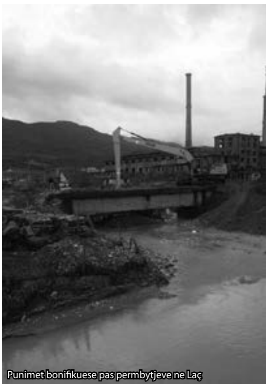
Punimet bonifikuese pas përmytjeve në Laç

Zgjidhja e maleve (Malet nuk bzajnë edhe përpara kohës kur Migjeni kërkonte t'i godiste me grusht të fuqishëm), mbetet nga formulat me sublime. Ato duhet të gjejnë veten, të mos rrinë të përziera, muzeu me jetën e absurdin. Qeveria së fundmi ua kalon pyjet e kullotat nën administrim qeverisjes vendore, ndërkohë që pyjet realisht janë nën rrënim. Ç'farë mund të bëhet? Më së pari vetëm investimet e fuqishme në pyje e prita malore mund ta zbusin së paku gjithë këtë zollum. Herët a vonë me domosdo do shkojmë edhe ne atje ku na kërkon e na pret Europa, por më parë na kërkohet që të shërojmë plagët që me dashje ose jo i kemi hapur vëntes e ndër ta të ndalim shkatërrimin e pyjeve e xhveshjen e maleve.