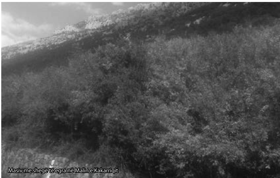
Masiv me shegë të egra në Malin e Kakarriqit

Masivi pyjor që mendohet të krijohet do të ndikojë edhe në stokimin (magazinin) e karbonit dhe përmirësimin e cilësisë së ajrit për zonën urbane të qytetit të Lezhës, njëkohësisht do të sjellë në vëmendje rëndësinë që, zona urbane pa pyll mbrojtës është si shtëpia pa çati. Projekti ka parashikuar që të mbillen gjithësejt 6 ha, nga të cilat katër ha janë me shegë dhe dy ha me akacie. Mendohet që të kultivohet shega e egër, si një bimë frutore-pyjore autoktone. Ku më mirë se sa në Lezhë, shega e egër do të ndihet si në shtëpinë e vet.