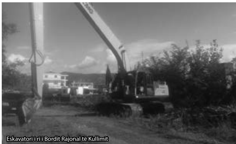
Eskavatori i ri i Bordit Rajonal të Kullimit

Nëse nuk kemi dhënë një panoramë të qartë për logjikën "pa logjikë" që ka përdorur qeveria për këtë mbështetje që pritet t'i vijë bujqësisë, po ju sjell edhe një statistikë tjetër, nxjerrë prej këtyre të dhënave: Puka e Pusteci me 6 mijë ha tokë së bashku dhe me "bujqësi pa bujqësi", do të marrin numër të njëjtë eskavatorësh, (tre) me Lushnjën e Lezhën, të cilat kanë bashkë një sipërfaqe prej 70 mijë ha. Të tjerat u thanë.