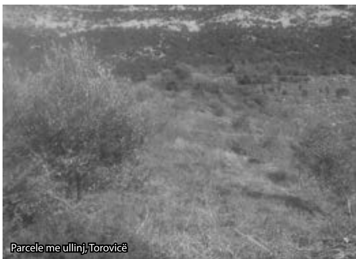
Parcelle me ullinj, Torovicë

Rrethi i Lezhës ka kushte të përshtatshme klimaterike dhe tokësore për kultivimin e kultures së ullirit, si në zonën fushore në tokat me strukturë të lehtë dhe pjesërisht gurishtore duke u kujdesur për një kullim sa më të mirë gjatë periudhës vjeshtë-dimër-pranverë dhe duke u shtrirë në zonën kodrinore deri në lartësi në pjesën perëndimore me ekspozicion nga perëndimi dhe jug-perëndimi, zonë që ka një shtrirje nga Krajni, Fishta, Troshani, Kallmeti, Rraboshta, Mërqia, Kolshi, Manatia, Treshi, Spiteni, Markatomaj, Zejmen, Pllanë, deri në Bërganë. Këtë e tregon më së miri kultivimi i kësaj kulture ndër vite dhe prania e ullishtave të vjetra disa vjeçare në të gjithë brezin e kësaj zone. Por krahas këtij brezi të lartëpërmendur, nuk mund të lëmë pa përmendur edhe një minibrez në pjesën kodrinore të Torovicës që ka po të njëjtat kushte klimatiko-tokësore dhe kjo kulturë po përshtatet dhe po shkon mjaft mirë. Ekspozicioni i kësaj zone me kundrejtim nga perëndimi dhe jug-perëndimi, është një faktor me shumë për shtrirjen e kësaj kulture në këtë zonë. Gjendja e ullishteve të vjetra ekzistuese nuk është ajo që duhej të ishte dhe sipërfaqja e tyre në rrethin e Lezhës nuk është e konsiderueshme, një sipërfaqe rreth 50 ha. Por në vitet 2007 e në vazhdim deri më 2013, me subvencionimin e kulturave drufutrore dhe kulturës së ullirit