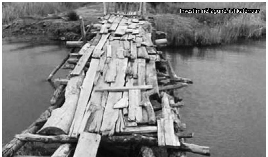
Investim në lagunë, i shkatërruar

Kjo konsiderohet si "Zona e parë e mbrojtur në Shqipëri". Sot laguna e Vainit së bashku me disa territore që e qarkojnë "Kune-Vain-Tale" sipas VKM nr.432, datë 28.04.2010, ka statusin "Rezervat Natyror i Menaxhuar/ Park Natyror".