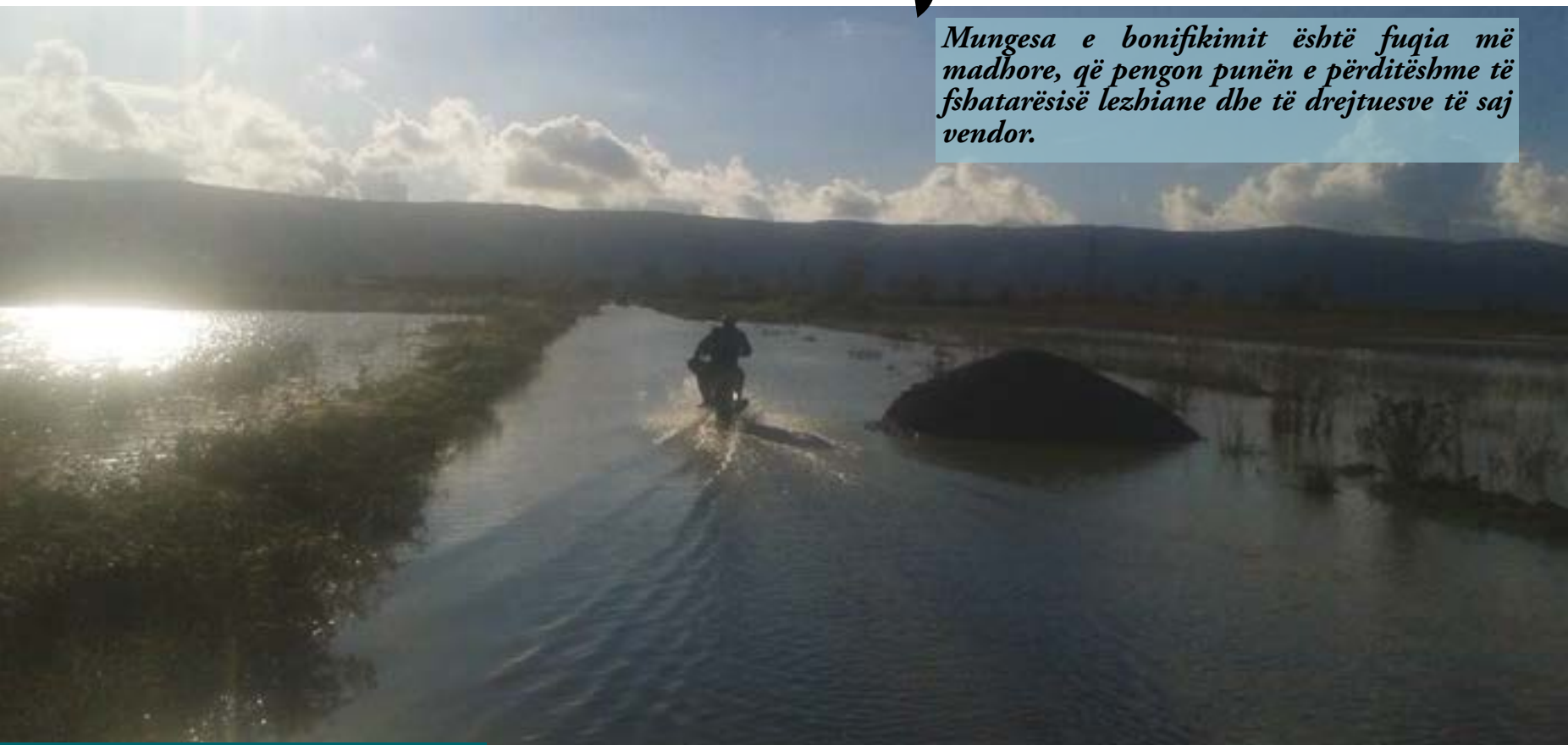
Përmbytje në Blinisht, Tetor 2016

Mungesa e bonifikimit është fuqia më madhore, që pengon punën e përditëshme të fshatarësisë lezhiane dhe të drejtuesve të saj vendor.