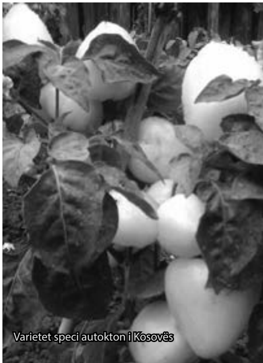
Varietet speci autokton i Kosovës

Aotearoa, siç e quajtën Zelandën e Re ardhësit e parë maorët, ndodhet në anën jugperëndimore të Oqeanit Paqësor, 8 mijë km larg bregdetit të Amerikës jugore, kurse në veri 2 mijë km e ndajnë nga bregu i Australisë lindore. Ka një sipërfaqe 269 mijë km katrorë, të përafërt me Britaninë e Madhe dhe Japoninë. Në strukturën etnike mbizotëron popullsia e ardhur evropiane. Zelanda përbëhet prej dy ishujve kryesorë: ishullit verior dhe atij jugor. Toka e reve të mëdha e të bardha është tokë kodrinore vullkanike e pasur me bimësi, lumenj, ujëra termalë, liqene, ujëvara dhe me vargmale e kodra. Vargmalet impozante me bukuri mahnitëse dhe vazhdimisht të mbuluara me borë janë Southern Alps (Alpet jugore) që shtrihen në Ishullin jugor. Maja më e lartë e këtyre maleve shkon deri në 3754 metra lartësi në Mountain Cook. Zelanda shtrihet në një gjatësi prej 1500 km nga veriu në jug. Ishulli verior karakterizohet me temperaturë më të butë dhe me popullsi më të dendur. Njerëzit e parë janë vendosur në këtë ishull të largët pak para shek. të X-të. Në Tokën e reve të bardha e të mëdha, maorët gjetën parajsën, vendin ku organizuan jetën e re në tokë të re dhe për këtë janë edhe sot shumë krenarë. Të ndodhur në mes të Paqësorit, ata jetuan me produktet e tokës dhe të detit. Evropiani i parë që shkeli në Aote-