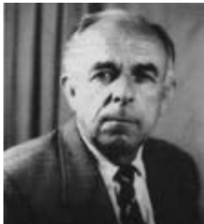
ILLO FOTO, ish specialist në Ministrinë e Bujqësisë, publicist.