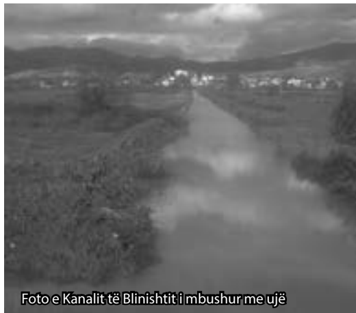
Foto e Kanalit të Blinishtit i mbushur me ujë

Çfarë na treguan reshjet e tetorit? Se është bërë njëfarë pune në disa zona, për të përballuar një intensitet normal të reshjeve e të shpërdarë në kohë normale, por jo, nuk jemi të zotët sot për sot, t'u bëjmë ball reshjeve që bien me intensitet të lartë dhe në fakt kur kanë kohën e tyre. Tetori na tregoi herët, pa hyrë dimri se ne nuk kemi shpëtuar prej përmytjeve. Punë të mëdha na presin, investime të fuqishme na duhen prej shtetit kryesisht, por edhe prej bashkisë. Kujdes, përgjegjësi e bashkëpunim duhet nga ana e vetë banorëve, të cilët duhet t'i trajtojnë kanalet kulluese si një pasuri që duhet të ruhet fort.