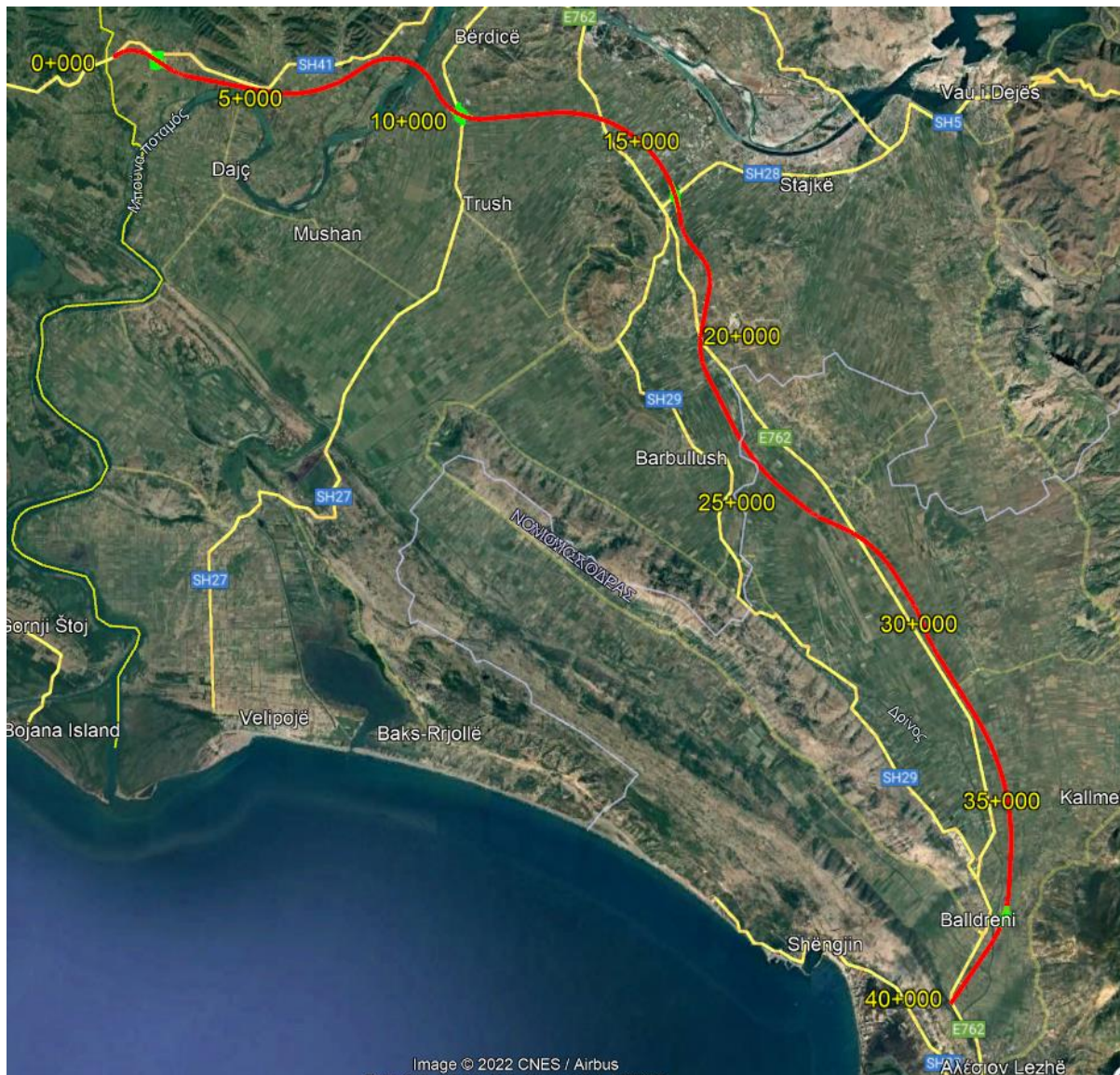
Figura 1: Pamje nga google earth i segmentit Murriqan - Lezhë

Projekti për rindërtimin e segmentit rrugor Murriqan – Lezhë është pjesë e Korridorit Adriatiko – Jonian (AIC), I cili është identifikuar si pjesë e Korridorit TEN-T Mesdhetar, duke shtrirë korridorin kryesor të rrjetit të BE-së në Rajonin e Ballkanit Perëndimor. Gjatesia e vlerësuar e të gjithë Korridorit të Mesdheut është rreth 1,550 km. Në Ballkanin Perëndimor, korridori kalon nëpër Mal të Zi (afërsisht 7% e gjatësisë totale) dhe Shqipëria (afërsisht 20% e gjatësisë totale ose rreth 300 km).